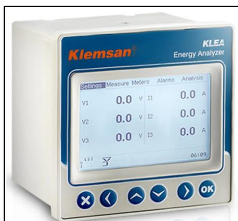
شکل ۲- دستگاه آنالیز انرژی

ضریب نفوذ مؤثر رطوبت ( D_{eff} ) به طور معمول با استفاده از شیب رابطه ۶ محاسبه