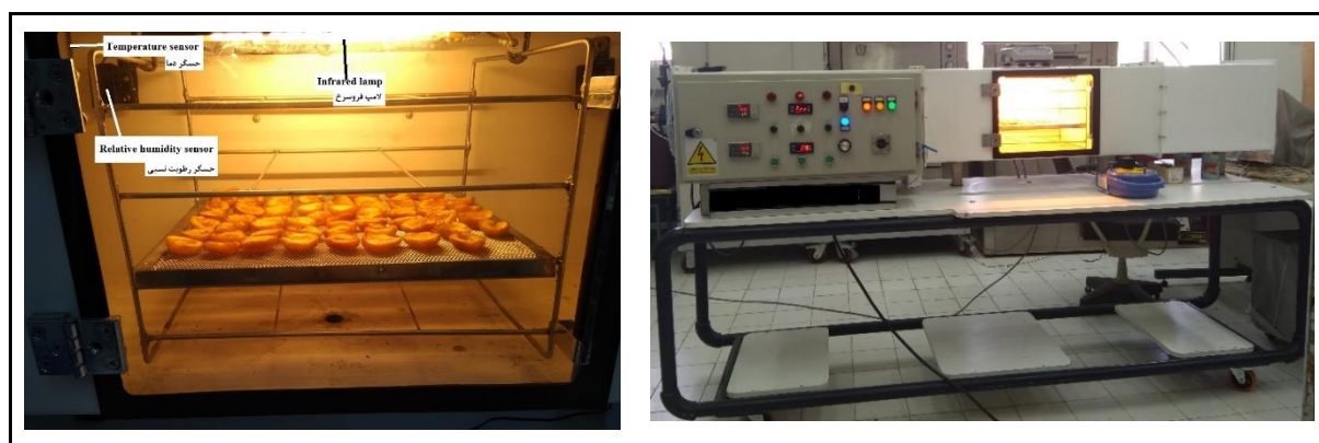
شکل ۱- خشک‌کن مورد استفاده

برای عملیات خشک کردن از یک خشک‌کن همرفتی نمونه‌سازی شده استفاده شد. این خشک‌کن به واحد پرتودهی فروسرخ و اندازه‌گیر انرژی مجهز گردید (شکل ۱). بدین منظور از دو لامپ میله‌ای فروسرخ به طول ۳۰ سانتی‌متر با حداکثر توان هزار وات و با زاویه تابش ۱۸۰ درجه در طراحی و ساخت واحد پرتودهی فروسرخ استفاده شد. لامپ‌های فروسرخ در قسمت میانی دستگاه در بالای قفسه‌های خشک‌کن نصب شد. تجهیزات لازم به منظور تنظیم توان لامپ‌های فروسرخ از طریق تغییر ولتاژ به تابلو فرمان خشک‌کن اضافه شد. این خشک‌کن شامل یک کانال و سه محفظه ورودی، میانی، خروجی و تابلو فرمان دستگاه بود. محفظه ورودی