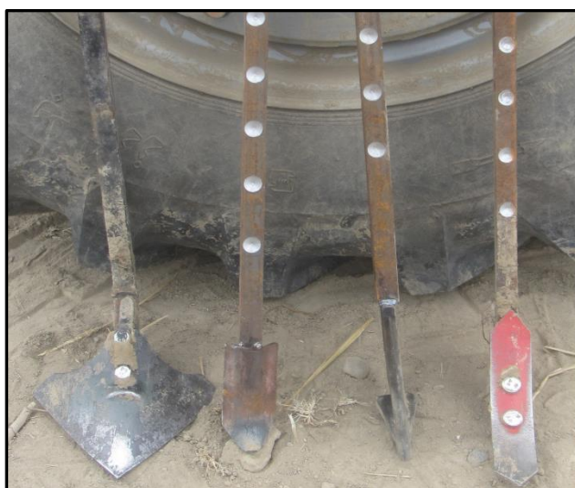
شکل ۲- چهار مدل عامل خاک‌ورز شاخه‌ای قابل نصب در جلوی کارنده به ترتیب از راست به چپ قلمی، T وارونه، ناخن‌دار و پنجه‌غازی