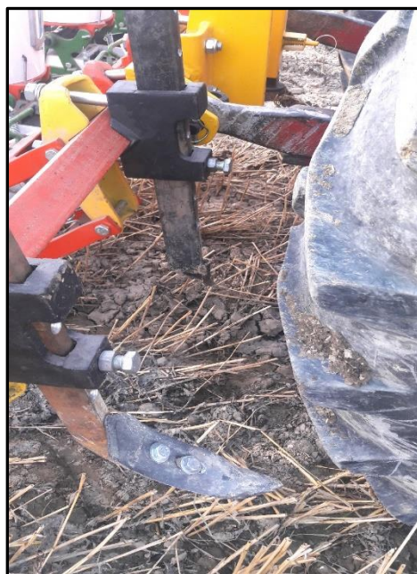
شکل ۱- خاک‌ورزهای نصب شده در جلوی واحدهای ردیف‌کار

خاک‌ورزهای ناخن‌دار و تی وارونه با جوش به ساقه متصل و خاک‌ورزهای قلمی و پنجه‌غازی با پیچ و مهره به ساقه وصل شدند (شکل ۲). زاویه حمله تیغه در خاک‌ورزها برای پنجه‌غازی، ناخن‌دار، قلمی و تی وارونه به ترتیب ۲۳/۸، ۴۹/۶، ۱۸ و ۶۰ درجه بودند و عرض تیغه‌ها نیز به ترتیب ۲۳۵، ۶۹، ۵۵ و ۴۸ میلی‌متر بودند.