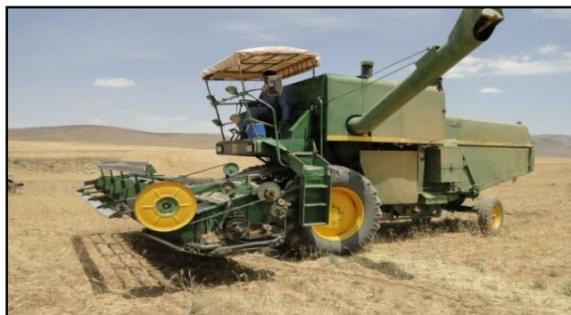
شکل ۲- کمباین معمولی جان‌دیر