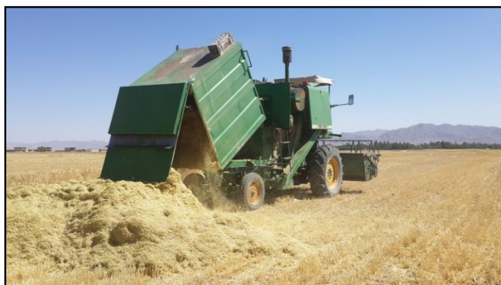
شکل ۱- کمباین کاه‌کوب

تلفات خرمن کوب در مخزن: تلفات این واحد شامل خوشه‌های نکوبیده، دانه‌های شکسته و ترک‌دار است. برای اندازه‌گیری این نوع تلفات، نمونه‌هایی (هر یک به