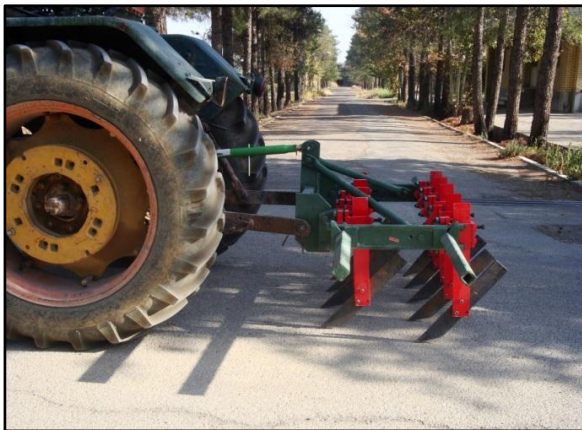
شکل ۲- شیاربازن تیغه‌باریک با زاویه تمایل ۵۳ درجه

آزمایش‌ها در کرت‌هایی به ابعاد ۳×۴۰ متر و در زمین شخم نخورده اجرا شد. ابتدا شیاربازن‌های کج‌ساق و تیغه‌باریک با زاویه‌های تمایل ۵۳ درجه و ۹۰ درجه ساخته و تأثیر آنها بر سبز شدن علف‌های هرز از طریق پارامترهای بانک بذر علف‌های هرز و عمق قرارگیری بذر علف‌های هرز اندازه‌گیری شد. در ضمن برای بررسی تأثیر عمق قرارگیری بذر در سبز شدن علف‌های هرز، آزمایش‌هایی در شرایط گلخانه و با بذر علف‌های هرز مرسوم نیز دنبال شد.