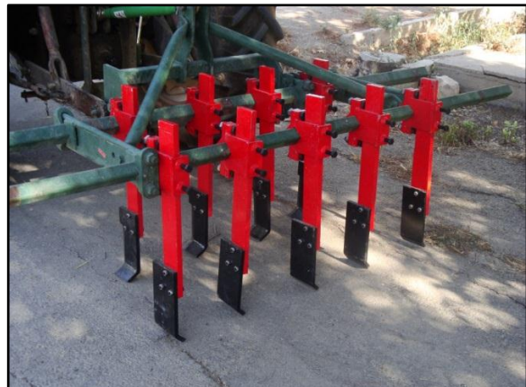
شکل ۱- شیاربازن کج‌ساق