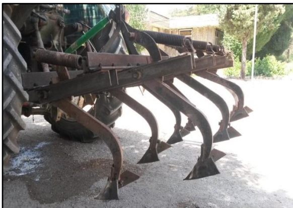
شکل ۴- شیاربازن پنجه‌غازی