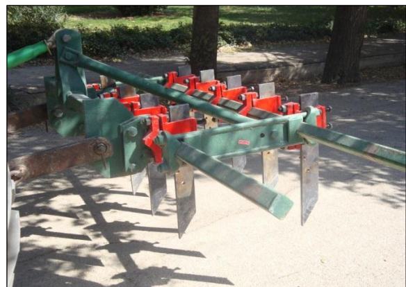
شکل ۳- شیاربازن تیغه باریک با زاویه تمایل ۹۰ درجه